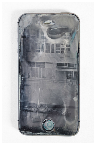
Implosion K Rochester (2022) - Impression UV, smartphones (modèle Iphone 5) - Œuvre simulée numériquement à gauche / Test réalisé avec une technique au collodion sur Iphones 4 à droite © Lucas Leffler